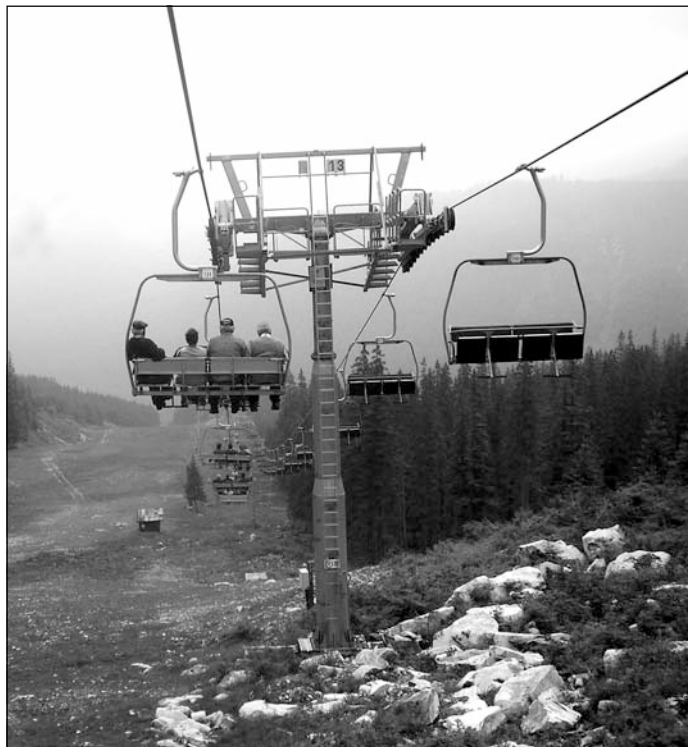
Štvorsedačková lanovka v lyžiarskom stredisku Roháče - Spálena podstatne zvýšila jeho kvalitu. V lete však lanovka premáva len výnimočne. Tentoraz jej služby využili zuberskí dôchodcovia.