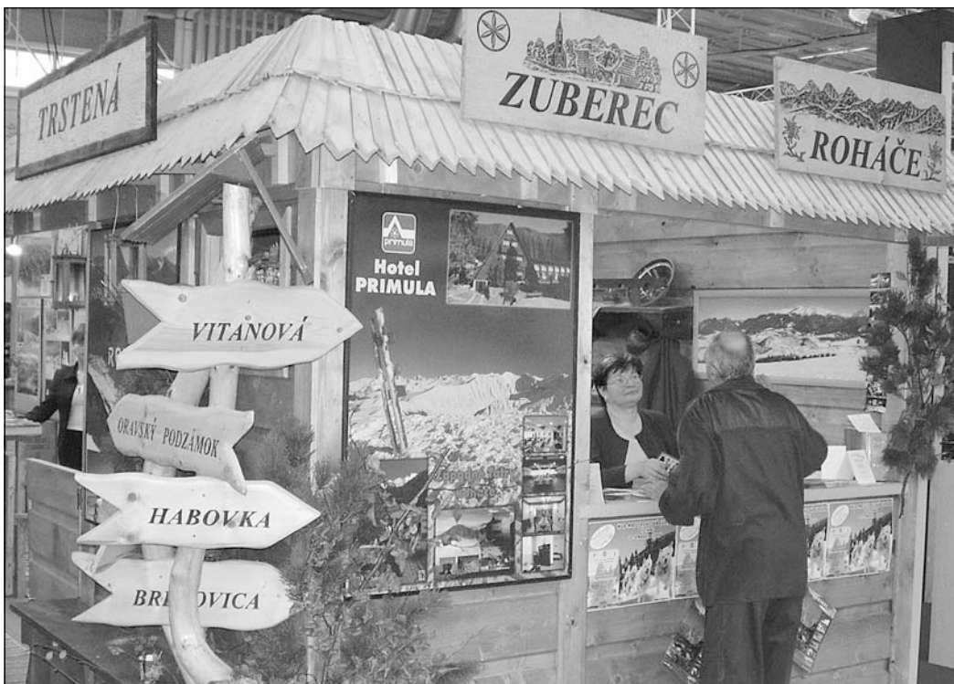
Stánok Obce Zuberec na výstave ITF Slovakiatour Bratislava.

Veľké okienko je voľné ešte jedno, malých desať. Bližšie informácie v TIKU. (II)