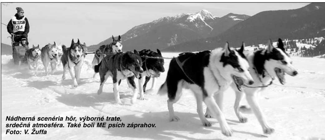
Nádherná scenéria hôr, výborné trate, srdečná atmosféra. Také boli ME psích záprahov.

Začiatok marca sa niesol v znamení historickej udalosti našej obce. Pricestovali tu reprezentanti krajín Európy, aby bojovali o tituly majstrov Európy v pretekoch psích záprahov na dlhých tratiach – distance. Členitá 40 km dlhá trať s nádherným, ale náročným profilom bola špeciálne pripravovaná a preparovaná pre tento európsky šampionát. Do pekne zasneženého Zuberca s predstihom prišli účastníci, aby sa dôkladne pripravili a správne načasovali špičkovú formu záprahových psov.