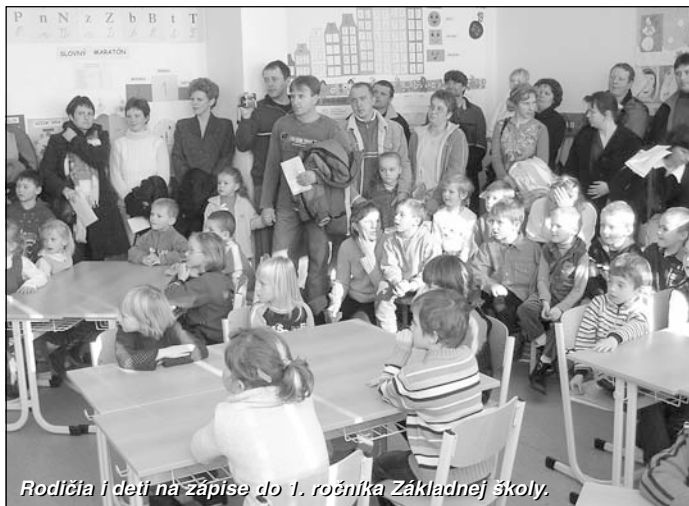
Rodičia i deti na zápise do 1. ročníka Základnej školy.